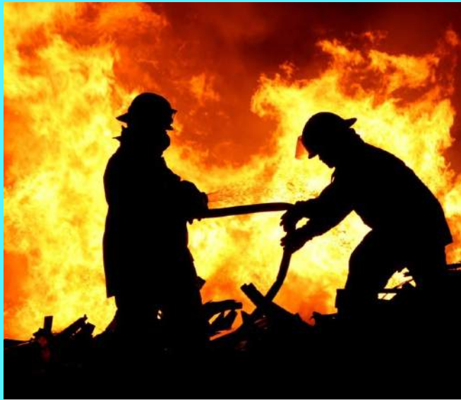
RÜCKRUF DROHT - es brennt lichterloh im Unternehmen

Beim Umgang mit Rückrufen herrscht jedoch nach wie vor große Unsicherheit. Das Problem: Es gibt kein bewährtes „Schema F“, nach dem der Rückruf abgewickelt wird. Jeder Rückruf ist anders und muss entsprechend behandelt werden.