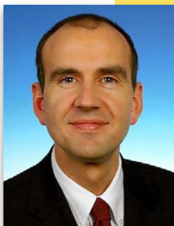
AUTOR MARCUS BURKERT, RECHTSANWALT

Über Referenzmarktmodelle versucht man, den enormen Aufwand internationaler Rückrufe abzumildern. Dabei verhalten sich die führenden Marken sehr unterschiedlich. Sie lernen das Anerkennungsverfahren ebenso kennen wie die Konzeptverantwortungsvereinbarung, an der sich Volkswagen orientiert. Wir haben Rückrufe erlebt, die bei einer Haftungsbeitragsung von 50:50 endeten. Es treten sogar Fälle auf, bei denen weder Fehler noch Ausfallursache festgestellt werden. Und dann? Interessant sind sicher auch die Gewährleistungsvereinbarung oder die pauschale Kostenermittlung.